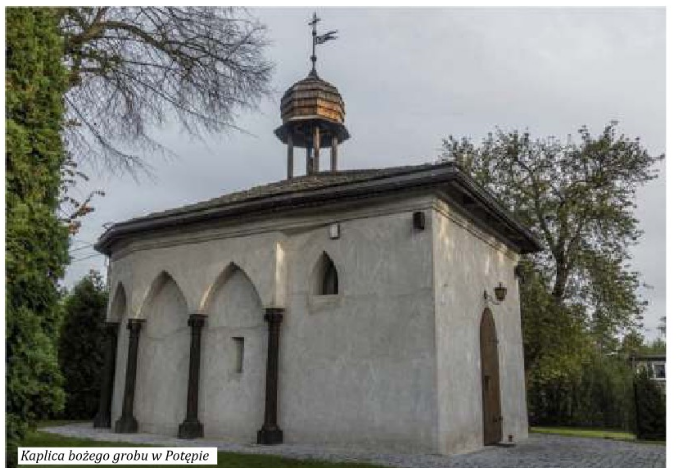
Kaplica bożego grobu w Potępie

Ta enigmatyczna kowalska zagadka wciąż czeka na rozwiązanie! Dla tych globtroterów, którzy w okresie Wielkanocy (i nie tylko) szukają wyciszenia i kontemplacji oraz wzmocnienia sił duchowych, proponuję pobyt w nowo powstałych trzech eremach na kaszubskiej Górze Polanowskiej . Tutaj odbywają się indywidualne rekolekcje dla każdego, kto chce zmierzyć się z życiem pustelników. Prosty styl życia rekolektanta, który musi zapew-