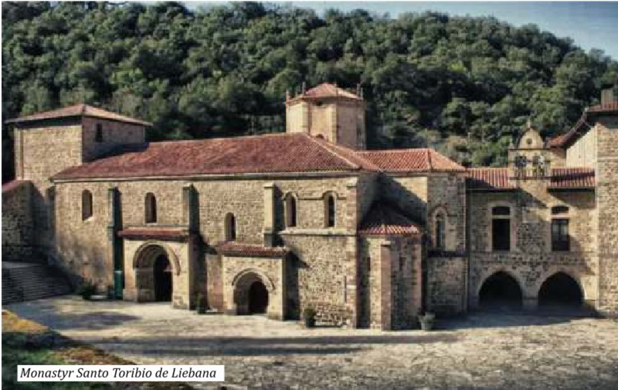
Monastyr Santo Toribio de Liebana

W oczekiwaniu na radosne bicie dzwonów ogłaszające światu Alleluja, czytając w głębokiej refleksji wiersz Marii Konopnickiej „Gdy świt się różowił” dający nam nadzieję w słowach: